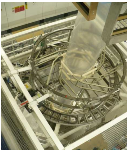
Kôš extrudéra – pohľad zvrchu