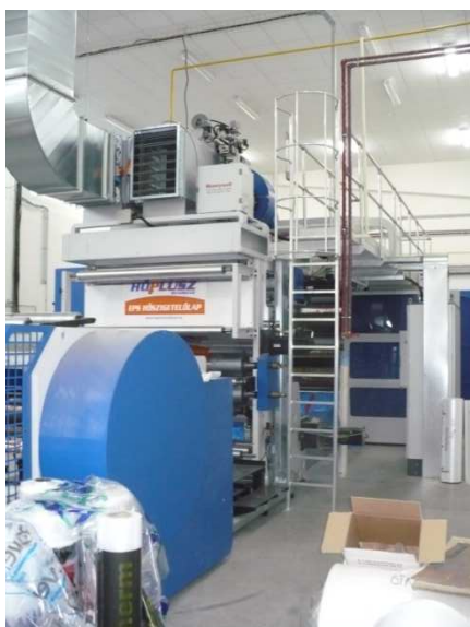
Zadná časť potlačovacej linky