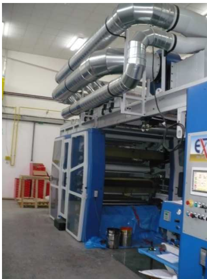
Potlačovacia linka – časť riadiacej jednotky s farebníkmi