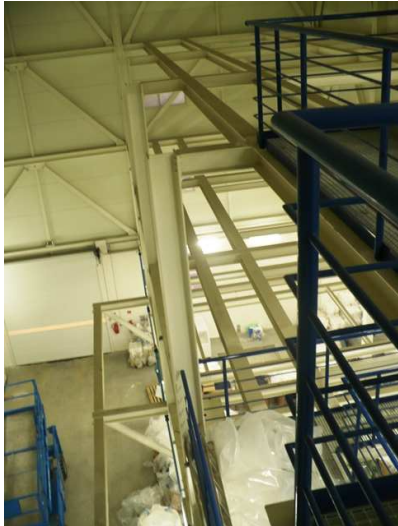
Voľné miesto pre extrudér 2. a 3.