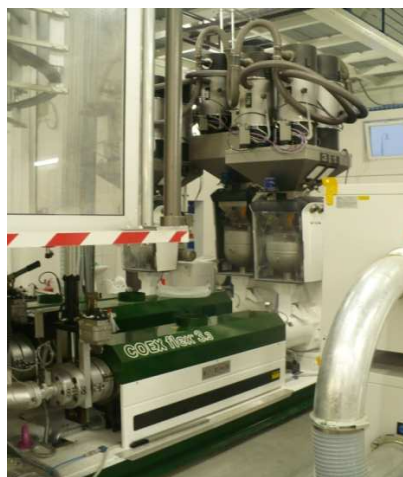
Gravimetrické dávkovače a extrudéry plastov