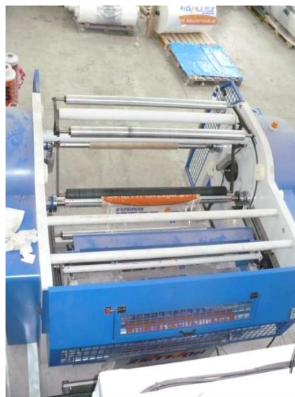
Navíjačka počas odovzdávky.