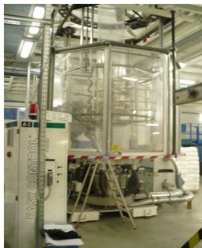
Vyfukovacia hlava s košom extrudéra