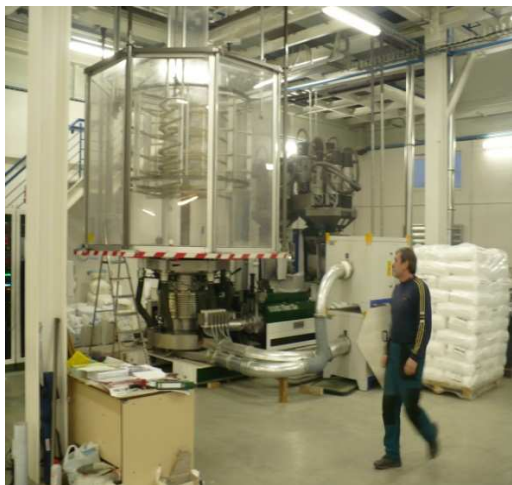
Celok počas montáže