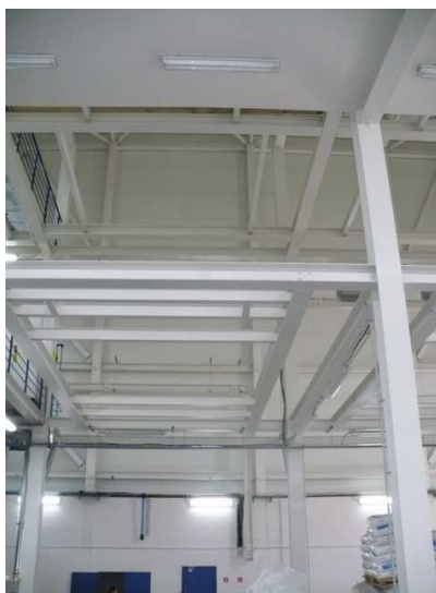
Voľné miesto v konštrukcii pre osadenie 2. extrudéra