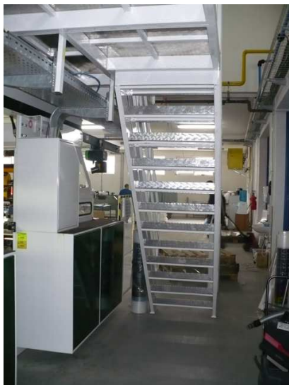
Časť schodiska s roštami