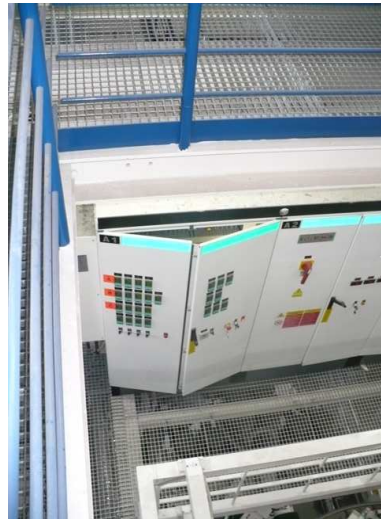
Časť roštov na 1. poschodí.