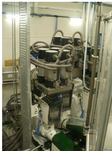
Gravimetrické dávkovače počas montáže