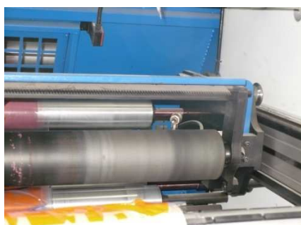
Nôž na odvíjačke počas odovzdávania linky