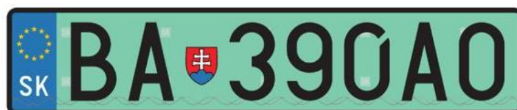
Vzor zelenej EVČ

Bližšie informácie o postupe pre vybavenie zelených EVČ nájdete TU .