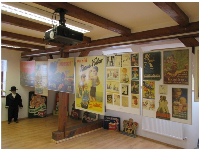
„Reklama a deti“

Výstava navštívila Regionální muzeum v Žďari nad Sázavou, kde bola umiestnená v prízemných miestnostiach sídelnej budovy – tzv. „Tvrze“. Ďalšou zastávkou bolo Městské muzeum v Moravskej Třebovej a výstava bola umiestnená vo výstavnom sále historickej budovy na poschodí. Neskôr sa výstava prezentovala v Historickom múzeu Městského múzea v Nejdku, patriacom Karlovarskému múzeu. Potom pokračovala do Městského múzea v Kamenici nad Lipou, kde bola vystavená na prízemí Zámku. Výstava už má dohovoréné termíny aj na rok 2015.