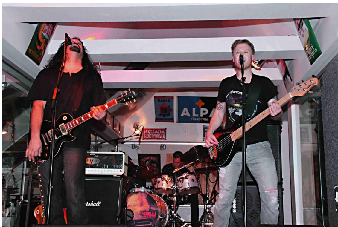
Vdelli - Austrália