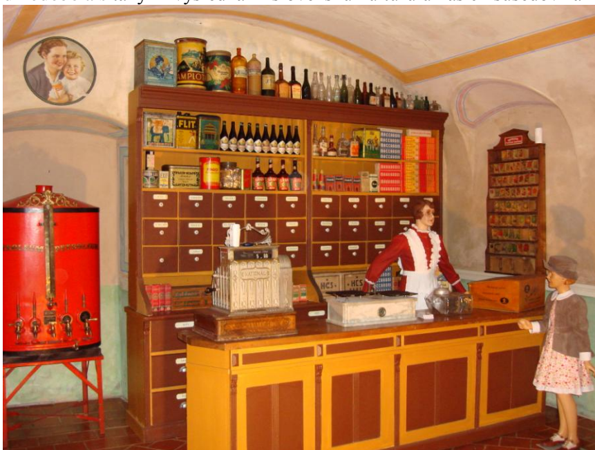
„C.K.Kupecký krám a Múzeum obchodu Český Krumlov“

Celá expozícia je zabezpečená EZS a vo vnútri bezdrôtovými premosteniami avizujúcimi prekročenie bezpečnostnej zóny. Otvorenie novej stálej expozície bolo jedným z najrevolučnejších momentov v živote MOB, vo svete slovenských múzeí išlo premiérový, jedinečný a bezkonkurenčný počín MOB v zahraničí, v meste – pamiatke UNESCO v Českom Krumlove. Umiestnená bola na najatraktívnejšom hlavnom turistickom ťahu v historických priestoroch prízemia goticko - renesančného meštianskeho domu. Projekt je dlhodobý a realizuje sa v spolupráci so spoločnosťou „C.K.Kupecký krám a Múzeum obchodu“ a vďaka firme „Finesa advertising“ České Budějovice - Borovany . Projekt je akýmsi vyvrcholením jedinečných, skoro 20 rokov trvajúcich výstavných aktivít Múzea obchodu Bratislava v Českej republike. Treba podotknúť, že málokterá ustanovizeň propaguje tak dlhodobo a s takými výsledkami slovenskú kultúru u našich susedov za riekou Moravou.