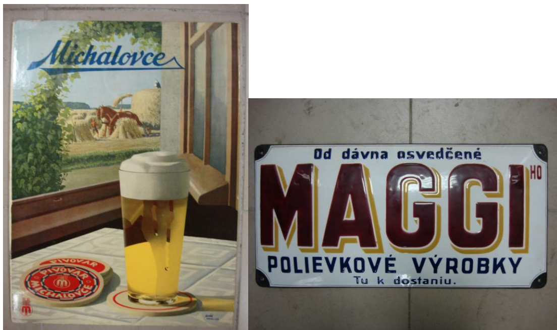
Predmety z akvizície 201 – kartónová výveska a smaltovaná reklamná tabu