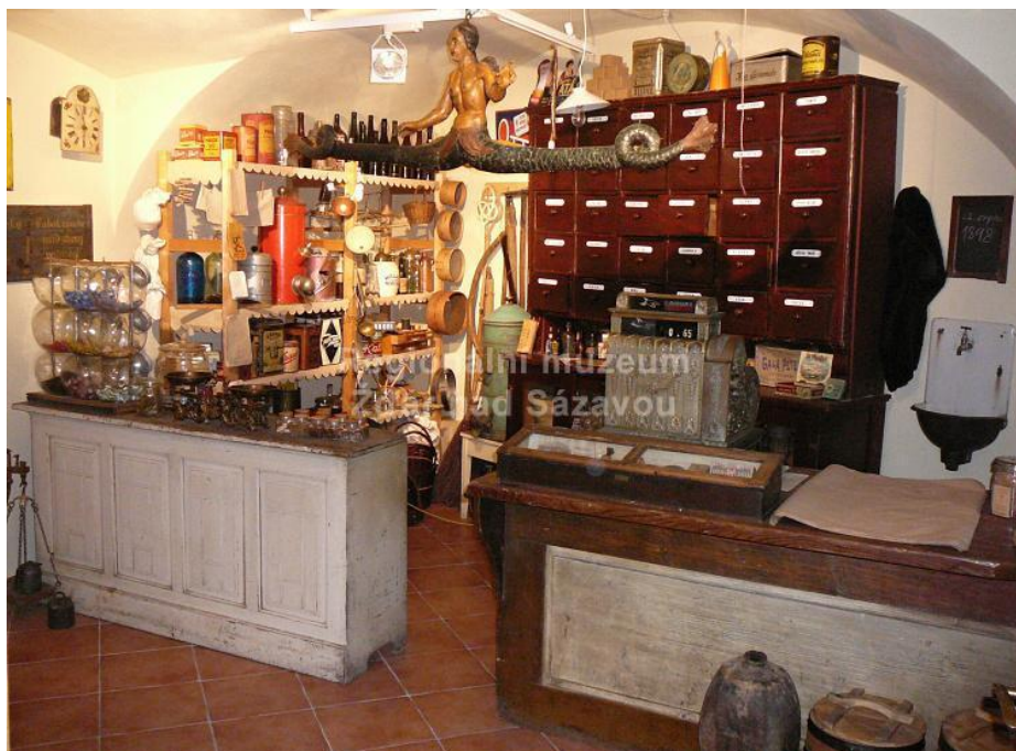
Regionální muzeum Žďár nad Sázavou

interiér obchodíka so zmiešaným tovarom v novej stálej expozícii regionálneho múzea Žďár nad Sázavou v zrekonštruovanom tzv. "Moučkovom dome".