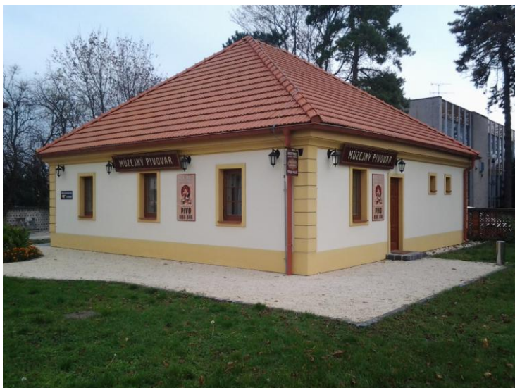
Historický hostinec – Múzejný pivovar