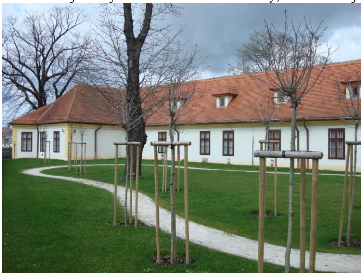
Historická záhrada MOB po revitalizácii

Doprava bola zabezpečovaná osobným motorovým vozidlom Mercedes Benz Vito, ktoré má najazdených 72.058 km a VW Caddy, ktoré má najazdených 354.526 km.