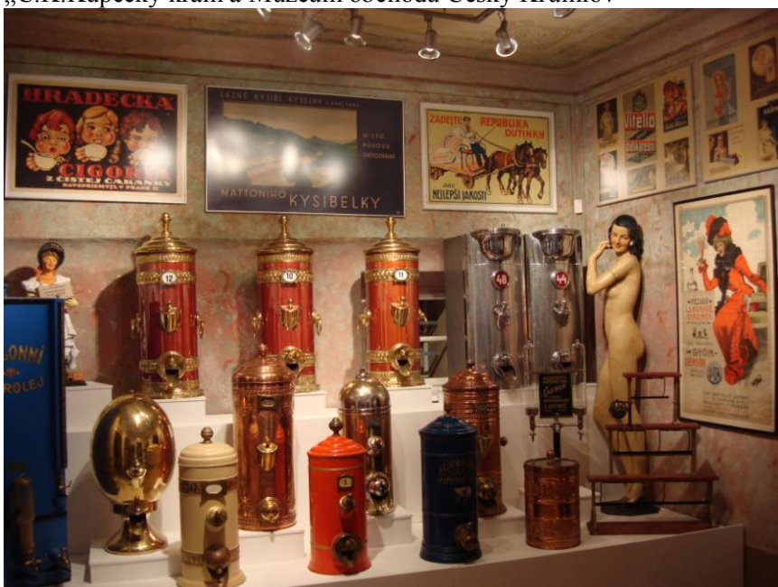
„C.K.Kupecký krám a Múzeum obchodu Český Krumlov“