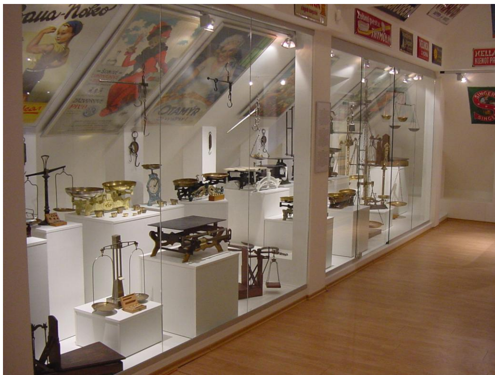
Stála expozícia Podunajské Biskupice – „Váhy

stalo nadmieru výnimočným a nadmieru atraktívnym minimálne v stredoeurópskom kontexte sveta múzeí a galérií.