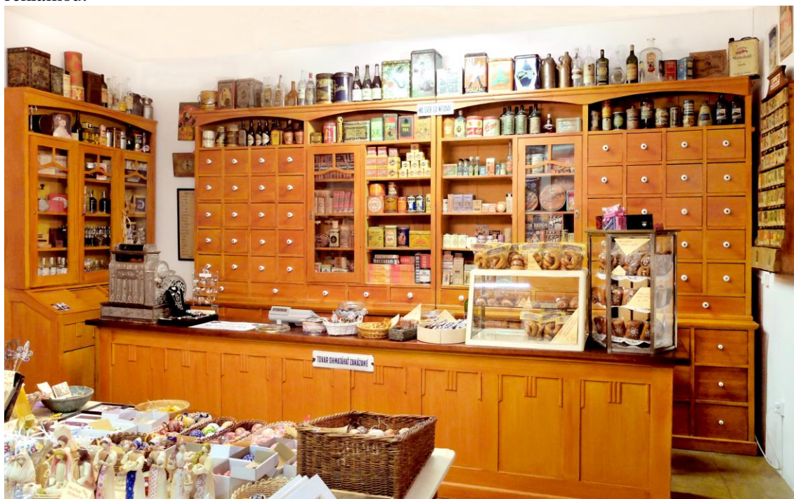
„Prešporský koloniál-Obchod v múzeu“

Expozícia „Prešporský koloniál - Obchod v múzeu“ umiestnená na prízemí goticko-renesančného domu, predstavuje podobný model, ako „krumlovská“. Vo vstupnej miestnosti zariadenej dobovým obchodným nábytkom a všadeprítomnou, historickou reklamou, ponúka partnerská firma Donet potraviny a nápoje so zameraním na unikátnych slovenských výrobcov, ďalej suveníry so vzťahom k Bratislave, či repliky historickej reklamy. V druhej miestnosti je expozícia zameraná na registračné pokladne firmy National, Krupp, Anker, Invicta a iných, doplnená sprievodnými textami a dobovou reklamou. V druhej miestnosti sú predmety z návštevnicky najatraktívnejších skupín, ako zásobníky na tovar, váhy, obaly, či historická chladnička na zmrzlinu. Vitríny sú venované výlučne historickým bratislavským firmám a ukážkam ich produkcie, alebo tovarov, ktoré predávali. Všetko je opäť doplnené historickou reklamou.