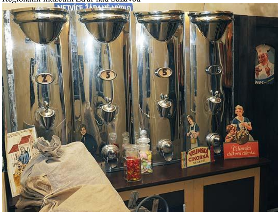
Múzeum Gastronómie, Praha.

Múzeum zapožičalo kolekciu predmetov pre Múzeum Spiša v Spišskej Novej Vsi a ďalej sa podieľa aj na stálej expozícii Múzea Janka Kráľa v Liptovskom Mikuláši, Poľnohospodárskom múzeu v Nitre, v Múzeu Jihovýchodní Moravy - Obuvníckom múzeu v Zlíne, Spolupráca sa započala aj s firmou „Znalekon“, ktorá zriadila „banický obchodík“ s dobovým interiérom v Banskej Bystrici v Španej Doline, a publikácie s pohostinskou tematikou boli zapožičané aj Slovenskej Národnej galérii. Múzeum zrealizovalo stálu prezentačnú výstavku v budove zriaďovateľa Ministerstva hospodárstva SR. Koncom roka 2014 bola realizovaná výstava priestoroch Úradu priemyselného vlastníctva SR v Banskej Bystrici, kde bol vystavený výber atraktívnej dobovej reklamy a obalovej techniky, či drobnejších predmetov vo vopred, na stálo zabudovaných vitrínach úradu..