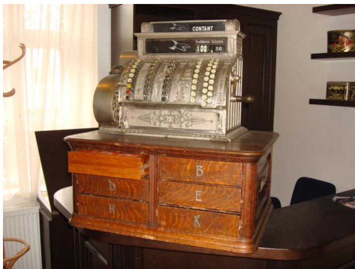
Zreštaurovaná registračná pokladňa.

Počas putovných výstav v Českej republike boli zvlášť poistené každá preprava a pobyt v jednotlivých múzeách. Rovnako je poistený celý zbierkový fond v rámci majetku múzea.