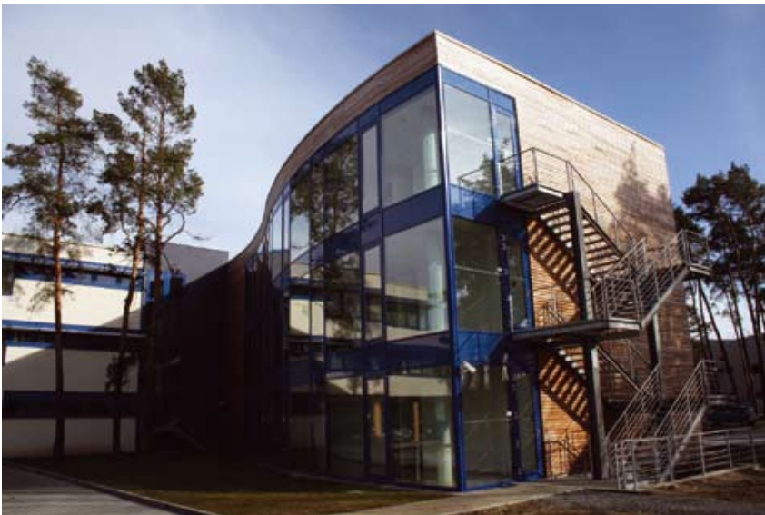
Vědeckotechnologický park v Plzni

Nanospider – světově vyspělá nanotechnologie využitá v průmyslové výrobě firmy ELMARCO